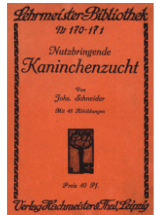
Abb. 4: "Nutzbringende Kaninchenzucht" von Schneider, J.; 1944 Schneider, 1911 13) unterschied drei Fütterungsarten: