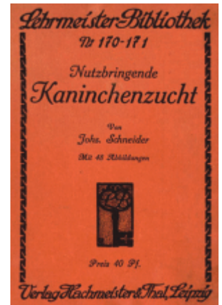
Abb. 4: "Nutzbringende Kaninchenzucht" von Schneider, J.; 1944Schneider, 1911 13) unterschied drei Fütterungsarten:

Milch mit Brot bekamen. Mit dieser Fütterung erkrankten oder starben weder ausgewachsene, noch Jungtiere.