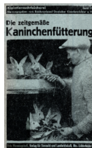
Abb. 6: "Die zeitgemäße Kaninchenfütterung" von Martin Gadsch aus dem Jahr 1944Von Gadsch, 1944 19) wurden als Unkräuter für die Kaninchenfütterung Hasenkohl (Gemeiner Rainkohl), Hirtentäschelkraut, Klebkraut, Klette, Ochsenzunge, Schöllkraut, Spörgel (Spark), Hahnenfuß, Brennnessel, Rainfarn, Beifuß, Ackerdistel, Kälberkropf, Hundskamille, Bienen-saug (Weiße Taubnessel), Frühlingskreuzkraut (Sencio vernalis), Gänsefingerkraut und Grindampfer (Stumpflblättriger Ampfer) aufgeführt.

Joppich, 1946 20) führte folgende Futtermittel für die Kaninchenzucht auf: