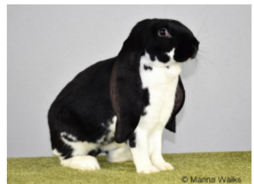
Abb. 4: Englischs Widderkaninchen (Weibchen), mantelgescheckt, schwarz-weiß. Bundessieger 2019Im Zuchtstandard des ZDRK, 2018 34) wird die Behanglänge und deren Bestimmung folgendermaßen beschrieben: „Die Behanglänge ist mit dem Zollstock über dem Kopf des Tieres von einer Spitze zur anderen zu messen. Dabei werden die Ohren mit der Schallöffnung nach vorne und ohne Drehung an den Zollstock angelegt. Die Ohren sind bei der Messung leicht anzuziehen. Die Behanglänge beträgt 54 bis 60 Zentimeter.“ ... „Die Breite der Ohren wird in der Mitte des Behanges

Es sind keine Untersuchungsergebnisse bekannt, die eine besondere Verletzungsgefahr bei Ohren von Kaninchen der Rasse „Englische Widder“ bestätigen würden. Prinzipiell sind Ohren bei Wildkaninchen verletzungsanfällig, ebenso wie bei Hauskaninchen in Gruppenhaltungen.