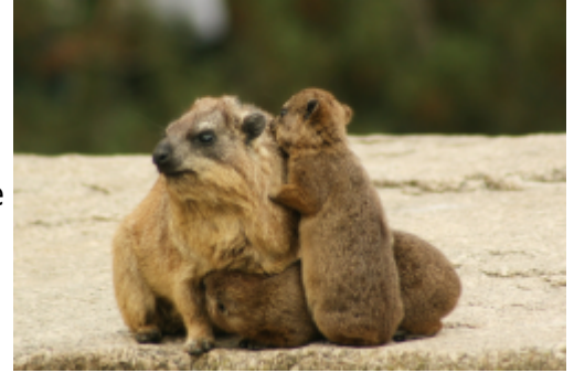
Abb. 3: Klippschlieferweibchen mit Jungtieren Neuere Bibelübersetzungen benutzen den Begriff "Klippdachs", ein anderes Wort für Klippschliefer. Diese Bezeichnung stammt von den Buren, den Afrikaans sprechenden, europäischstämmigen Einwohnern Südafrikas und Namibias. Sie nannten die Tiere „Boomdass“ (Dass = Dachs) 7) .

Die Kaninchen lösten im Altertum Hasen als Haustiere ab, deren Bestände in der Haltung immer wieder durch Wildfänge aufgefüllt werden mussten, weil sie sich in Gefangenschaft nur selten und nicht so zahlreich wie Kaninchen vermehrten. Außerdem galten sie als beliebtes Jagdobjekt und dienten Dank der bequemen Haltung sowie ihrer enormen Vermehrungsrate als Frischfleischvorrat. Von den Spaniern übernahmen die Römer den Brauch des Verzehrs von Föten und Neugeborenen der Kaninchen. Da diese „Delikatesse“ von der Kirche als Fastenspeise erlaubt war, wurde die Kaninchenhaltung später durch Klöster fortgeführt.