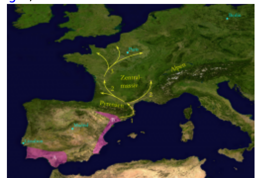
Abb. 2: Natürliche Ausbreitung des Wildkaninchens nach der Eiszeit: rot = natürliche Lebensräume von A: " Oryctolagus cuniculus algirus " und B: " Oryctolagus cuniculus cuniculus "; Satellitenbild: (c) NASA, 2002; bearbeitet

Im Süden Spaniens bildeten sich zwei geographisch voneinander getrennte Linien des Wildkaninchens, die sich allerdings auch überlappten. Alle Kaninchen, die heute in Europa leben, alle Hauskaninchen und die Kaninchen in Australien stammen von „ Oryctolagus cuniculus cuniculus “ ab, die im Norden und Osten Spaniens überlebten, während die Kaninchen auf den Azoren auf „ Oryctolagus cuniculus algirus “ zurückgehen. Diese Unterart lebt im Süden Portugals und Spaniens. Nach der letzten Eiszeit besiedelte das Wildkaninchen von Spanien aus zunächst wieder Südfrankreich. Es wird angenommen, dass die Ausbreitung nach Frankreich in aufeinanderfolgenden Etappen verlief (nach Queney et al., 2001) 4) , siehe auch Abbildung 2 , 5) :