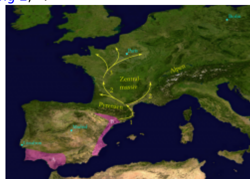
Abb. 2: Natürliche Ausbreitung des Wildkaninchens nach der Eiszeit: rot = natürliche Lebensräume von A: " Oryctolagus cuniculus algirus " und B: " Oryctolagus cuniculus cuniculus "; Satellitenbild: (c) NASA, 2002; bearbeitet

Im Süden Spaniens bildeten sich zwei geographisch voneinander getrennte Linien des Wildkaninchens, die sich allerdings auch überlappten. Alle Kaninchen, die heute in Europa leben, alle Hauskaninchen und die Kaninchen in Australien stammen von „ Oryctolagus cuniculus cuniculus “ ab, die im Norden und Osten Spaniens überlebten, während die Kaninchen auf den Azoren auf „ Oryctolagus cuniculus algirus “ zurückgehen. Diese Unterart lebt im Süden Portugals und Spaniens. Nach der letzten Eiszeit besiedelte das Wildkaninchen von Spanien aus zunächst wieder Südfrankreich. Es wird angenommen, dass die Ausbreitung nach Frankreich in aufeinanderfolgenden Etappen verlief (nach Queney et al., 2001) 4) , siehe auch Abbildung 2 , 5) :