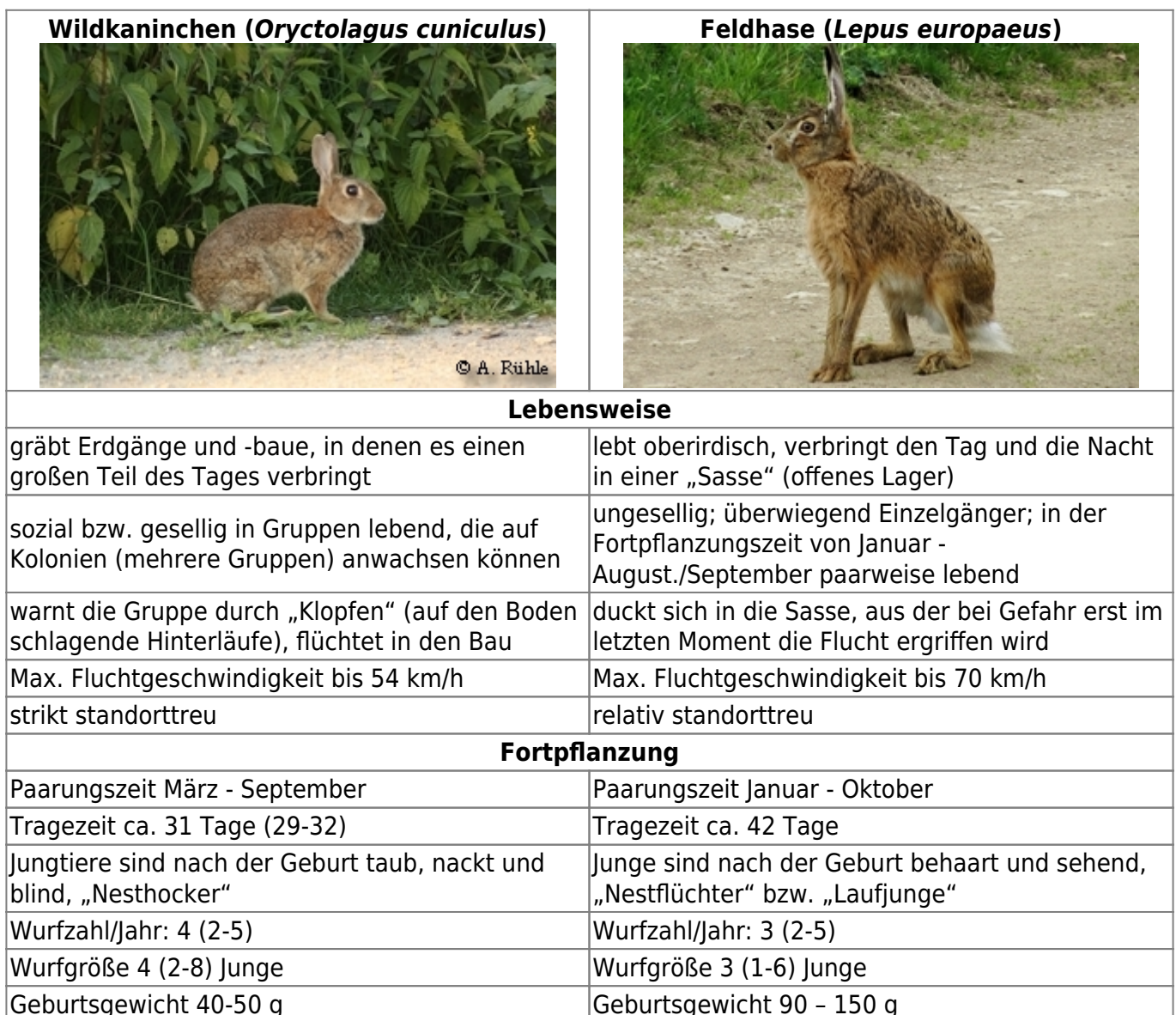
Tabelle 2: Vergleich einiger Merkmale von Wildkaninchen ( Oryctolagus cuniculus ) und Feldhase ( Lepus europaeus ); aus (Angermann, 1972) 1) , (Nachtsheim, et al., 1977) 2) , (Leicht, 1979) 3) , (Gibb, et al., 1994) 4) , (Bensinger, 2002) 5) , (von Holst, 2004) 6) , (Pegel, 2005) 7)

Das Wildkaninchen wird oft mit dem Feldhasen ( Lepus europaeus ) verwechselt. In der folgenden Tabelle sind Unterschiede zwischen den beiden Arten aufgeführt.