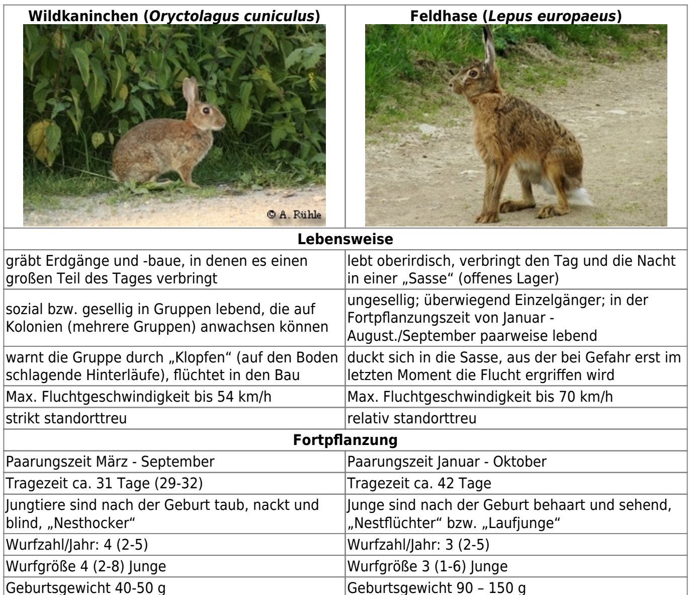
Tabelle 2: Vergleich einiger Merkmale von Wildkaninchen ( Oryctolagus cuniculus ) und Feldhase ( Lepus europaeus ); aus (Angermann, 1972) 1) , (Nachtsheim, et al., 1977) 2) , (Leicht, 1979) 3) , (Gibb, et al., 1994) 4) , (Bensinger, 2002) 5) , (von Holst, 2004) 6) , (Pegel, 2005) 7)

Das Wildkaninchen wird oft mit dem Feldhasen ( Lepus europaeus ) verwechselt. In der folgenden Tabelle sind Unterschiede zwischen den beiden Arten aufgeführt.