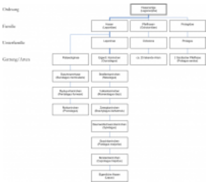
Abb. 1: Systematik der Hasenartigen (Lagomorpha)

Das Europäische Wildkaninchen ( Oryctolagus cuniculus ) gehört im zoologischen System zur Ordnung der Hasenartigen (Lagomorpha) und ist nicht mit Nagetieren (Rodentia) verwandt. Die häufig benutzte, umgangssprachliche Formulierung „Nager“ als Bezeichnung für Kaninchen ist also falsch.