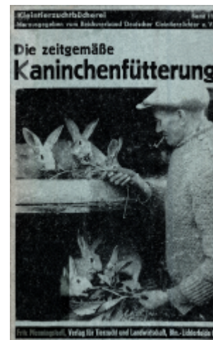
Abb. 6: "Die zeitgemäße Kaninchenfütterung" von Martin Gadsch aus dem Jahr 1944Von Gadsch, 1944 19) wurden als Unkräuter für die Kaninchenfütterung Hasenkohl (Gemeiner Rainkohl), Hirtentäschelkraut, Klebkraut, Klette, Ochsenzunge, Schöllkraut, Spörgel (Spark), Hahnenfuß, Brennnessel, Rainfarn, Beifuß, Ackerdistel, Kälberkropf, Hundskamille, Bienen-saug (Weiße Taubnessel), Frühlingskreuzkraut (Sencio vernalis), Gänsefingerkraut und Grindampfer (Stumpfbältriger Ampfer) aufgeführt.

Joppich, 1946 20) führte folgende Futtermittel für die Kaninchenzucht auf: