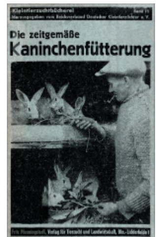
Abb. 6: "Die zeitgemäße Kaninchenfütterung" von Martin Gadsch aus dem Jahr 1944Von Gadsch, 1944 19) wurden als Unkräuter für die Kaninchenfütterung Hasenkohl (Gemeiner Rainkohl), Hirtentäschelkraut, Klebkraut, Klette, Ochsenzunge, Schöllkraut, Spörgel (Spark), Hahnenfuß, Brennnessel, Rainfarn, Beifuß, Ackerdistel, Kälberkropf, Hundskamille, Bienen-saug (Weiße Taubnessel), Frühlingskreuzkraut (Sencio vernalis), Gänsefingerkraut und Grindampfer (Stumpflättriger Ampfer) aufgeführt.

Joppich, 1946 20) führte folgende Futtermittel für die Kaninchenzucht auf: