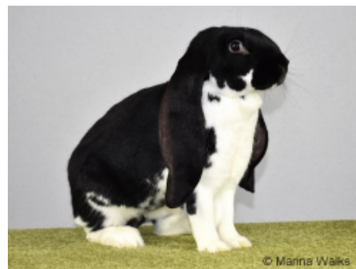
Abb. 4: Englisches Widderkaninchen (Weibchen), mantelgescheckt, schwarz-weiß. Bundessieger 2019Im Zuchtstandard des ZDRK, 2018 34 wird die Behanglänge und deren Bestimmung folgendermaßen beschrieben: „Die Behanglänge ist mit dem Zollstock über dem Kopf des Tieres von einer Spitze zur anderen zu messen. Dabei werden die Ohren mit der Schallöffnung nach vorne und ohne Drehung an den Zollstock angelegt. Die Ohren sind bei der Messung leicht anzuziehen. Die Behanglänge beträgt 54 bis 60 Zentimeter.“ ... „Die Breite der Ohren wird in der Mitte des Behanges

Es sind keine Untersuchungsergebnisse bekannt, die eine besondere Verletzungsgefahr bei Ohren von Kaninchen der Rasse „Englische Widder“ bestätigen würden. Prinzipiell sind Ohren bei Wildkaninchen verletzungsanfällig, ebenso wie bei Hauskaninchen in Gruppenhaltungen.