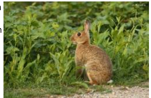
Abb. 2: Wildkaninchen frisst Acker-Schöterich-Blätter ( Erysimum cheiranthoides ) Das Kaninchen zählt unter den Herbivoren zu den Folivoren. Das heißt, es ernährt sich bevorzugt von Pflanzen und von diesen wiederum von den Blättern. „Bevorzugt“ bedeutet, dass es blättrige Bestandteile von grünen Pflanzen anderer Nahrung vorzieht, solange diese die Nährstoffe enthält, die es zum Aufbau und Erhalt seines Körpers und zur Fortpflanzung benötigt.

Daneben kann auch andere Nahrung als Ersatz oder als Ergänzung gefressen werden, so z. B. Wurzeln, Samen, Früchte, kleine Zweige oder Äste sowie die Rinde von Bäumen und Sträuchern.