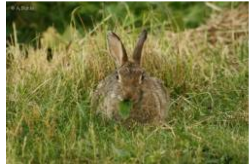
Abb. 1: Wildkaninchen frisst ein Breitwegerichblatt ( Plantago major ) Unter Nahrung wird Ess- und Trinkbares verstanden, das ein Lebewesen zum Aufbau und Erhaltung des Organismus sowie zur Fortpflanzung benötigt. Entsprechend der bevorzugten, das heißt überwiegenden Aufnahme von Nahrung unterscheidet man zwischen Fleischfressern (Karnivoren), Pflanzenfressern (Herbivoren) und Allesfressern (Omnivoren). Pflanzenfresser werden wiederum unterschieden in: