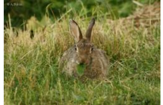
Abb. 1: Wildkaninchen frisst ein Breitwegerichblatt ( Plantago major ) Unter Nahrung wird Ess- und Trinkbares verstanden, das ein Lebewesen zum Aufbau und Erhaltung des Organismus sowie zur Fortpflanzung benötigt. Entsprechend der bevorzugten, das heißt überwiegenden Aufnahme von Nahrung unterscheidet man zwischen Fleischfressern (Karnivoren), Pflanzenfressern (Herbivoren) und Allesfressern (Omnivoren). Pflanzenfresser werden wiederum unterschieden in: