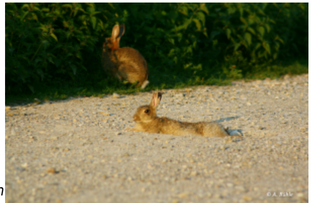
Abb. 2: Wildkaninchen beim "Sonnenbaden" Kaninchen werden in der Literatur häufig als „überwiegend dämmerungs- und nachtaktiv“ beschrieben. Daraus könnte man schließen, dass sie eigentlich nur sehr selten natürlichem Sonnenlicht ausgesetzt sind. In ihrer Dissertation zitiert Hansen, 2012 15) eine Aussage von Kamphues, 1999 16) , nach der es diskussionswürdig wäre, „ob die unter natürlichen Bedingungen tagsüber in unterirdischen Höhlen lebende und im Wesentlichen nur nachts aktive Spezies überhaupt einen „üblichen Vitamin D-Bedarf“ hätte, da die notwendige UV-Strahlung zur

Umwandlung des mit der pflanzlichen Nahrung aufgenommenen Vitamin D 2 (Ergocalciferol) unter diesen Bedingungen ohnehin fehle. Abb. 3: Wildkaninchen beim "Sonnenbaden" Zum einen widersprechen die vorangestellten Ergebnisse aus Literaturangaben dieser Annahme, zum anderen zeigen Beobachtungen verschiedener Gruppen von Wildkaninchen an verschiedenen Orten, dass diese auch tagsüber mehr oder weniger Zeit außerhalb des Baus verbringen.